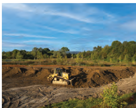
Septembre 2023, l'apport de terres des chantiers locaux et travaux de terrassement des modelés