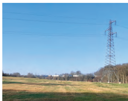
Février 2023, état initial du site

La conception et l'aménagement du site ont été entièrement financés par ECT Hauts-de-France grâce à la valorisation des terres inertes issues des chantiers locaux de la construction, sans coût pour la Commune. La réutilisation des terres sur le site permet de créer les modelés et d'adapter le terrain aux futurs usages environnementaux et sociétaux. ECT Hauts-de-France a pris en charge toutes les phases du projet : conception, autorisation administrative, accueil des terres et aménagement du site.