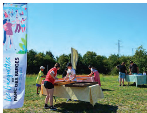
La guinguette éphémère