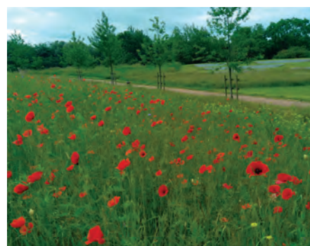
Juin 2024, la prairie fleurie