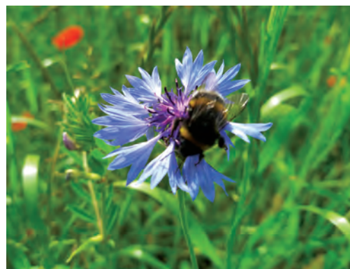
Juin 2024 : la prairie fleurie