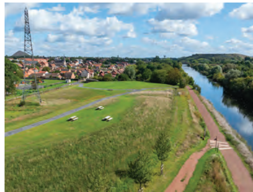
Belvédère avec vue sur la Souchez

Le parc favorise la protection de la faune et de la flore locales par la création de zone boisées et de prairies fleuries. Ces milieux diversifiés enrichissent la biodiversité, créent des habitats essentiels pour les oiseaux, les insectes et d'autres espèces, tout en offrant un espace naturel où les habitants et riverains peuvent profiter de la nature dans un cadre agréable et reposant.