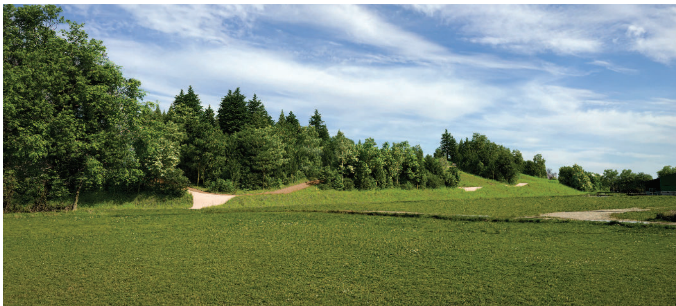
Vue du parcours sportif

La réutilisation de terres inertes des chantiers du BTP sur le site permet de réaliser ce nouvel aménagement naturel adapté à la pratique sportive (marche, course à pied, VTT cross country) et de financer entièrement sa transformation. ECT prend en charge toutes les phases du projet : conception, obtention des autorisations administratives, traçabilité des terres, terrassement et aménagement des équipements verts et sportifs.