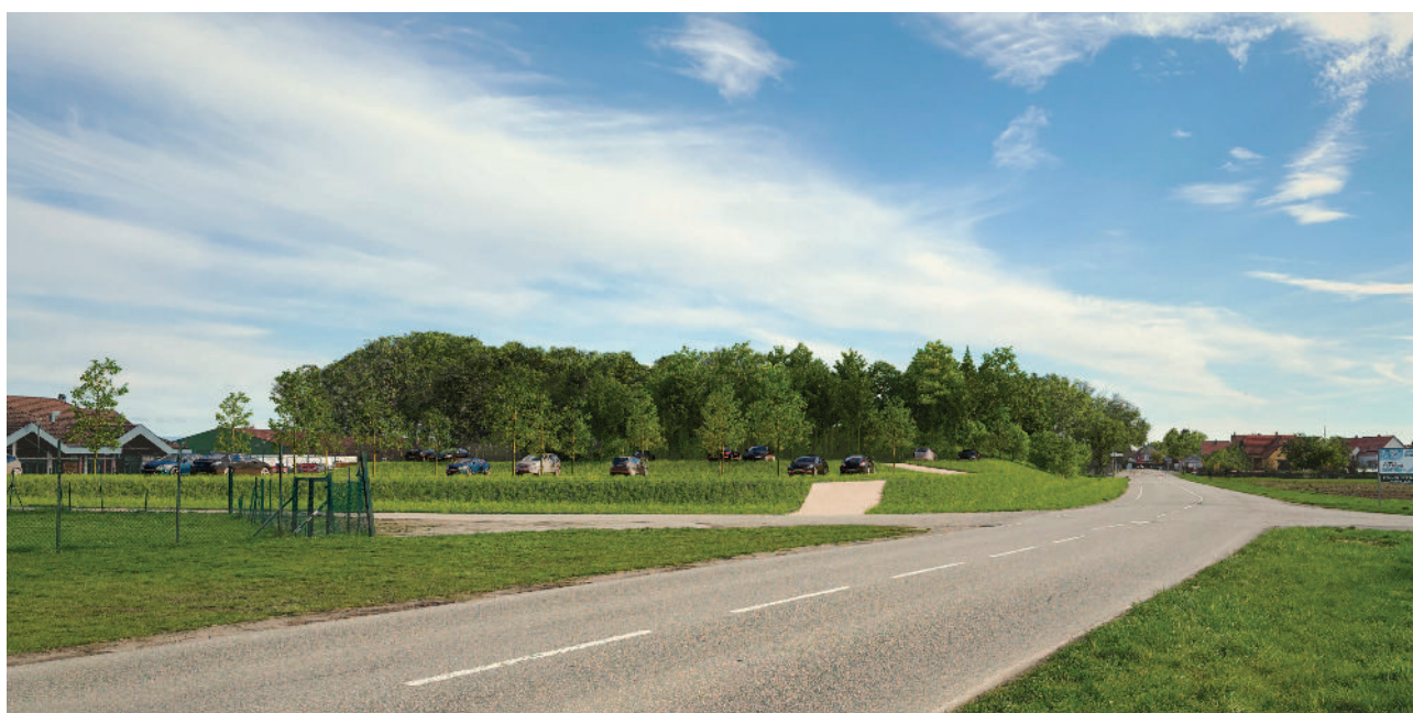
Depuis la route d'Olwisheim, vue sur le parking arboré et la butte paysagère